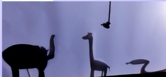
Les animaux contre le harcèlement