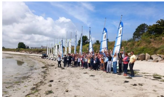
La Forest à petite foulée

Parents et enfants étaient ravis de cette sortie qui a clos la saison. Tous se sont donnés rendez-vous à la rentrée, au forum des associations.