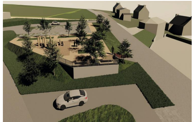
Futur belvédère aux abords de l'école publique

Nous remercions encore une fois les Forestois pour leur patience durant cette période chargée en travaux.