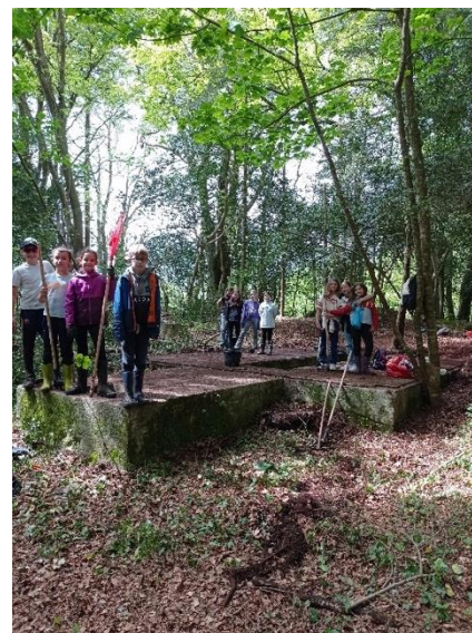
Photo du nettoyage des vestiges du camp de prisonniers par les jeunes du foyer. (3 mai)