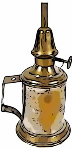
Lampe à pigeon

Aujourd'hui le lavoir est sauvegardé tant bien que mal afin de conserver la trace d'une époque difficile, où l'on se retrouvait, les mains dans l'eau.