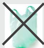
Emballage autour des bouteilles et sac en plastique